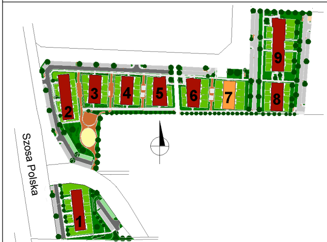
SCHEMAT ROZMIESZCZENIA MIESZKAŃ BUDYNKU NR 7