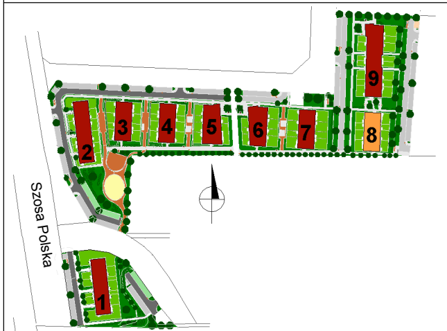
SCHEMAT ROZMIESZCZENIA MIESZKAŃ BUDYNKU NR 8